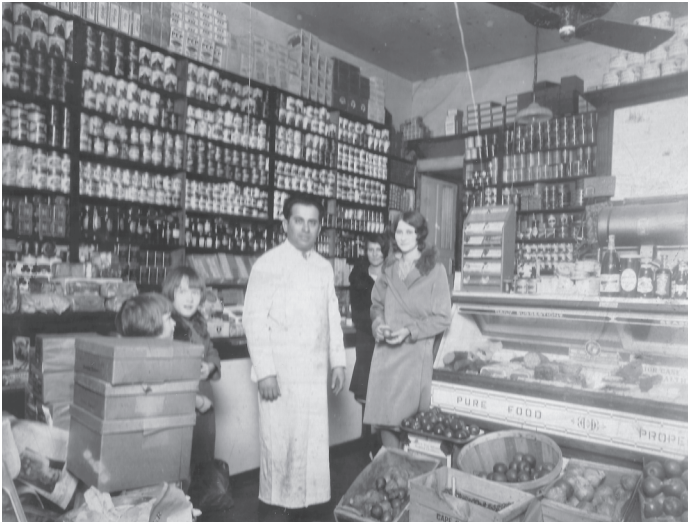
Der Vater des Autors in seinem Lebensmittelgeschäft, um 1930.

tauchten andere vergessene Erinnerungen auf. Eines regnerischen Abends, als das Geschäft voller Kunden war, schnappte sich ein riesiger, bedrohlich aussehender Mann eine Kiste Alkoholika und lief damit auf die Straße. Ohne zu zögern, ließ mein Vater alles stehen und liegen, und meine Mutter und ich blieben in einem Geschäft zurück, in dem sich die Kunden drängten. Fünfzehn Minuten später kam mein Vater mit der Kiste Alkohol zurück – der Dieb hatte nach zwei oder drei Straßenblocks aufgegeben, seine Beute fallen lassen und sich aus dem Staub gemacht. Eine reife Leistung meines Vaters. Ich bin nicht sicher, ob ich den Mut zu dieser Jagd gehabt hätte. Ich muss stolz auf ihn gewesen sein – wie hätte es anders sein können? Aber merkwürdigerweise hatte ich diese Erinnerung nicht zugelassen. Hatte ich mich je hingesezt und darüber nachgedacht, wirklich darüber nachgedacht, wie sein Leben so war?