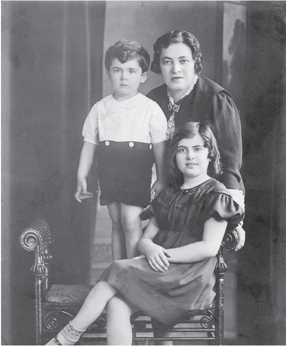
Der Autor mit seiner Mutter und seiner Schwester, um 1934.

Ja, meine Mutter hatte allen Grund, erleichtert zu sein, als ich mit einundzwanzig für immer aus dem Haus ging. Ich war ein Störenfried. Sie hatte nie ein positives Wort für mich, und ich stand ihr da in nichts nach. Während ich auf meinem Rad eine lange Strecke abwärts fahre, schweifen meine Gedanken zurück zu der Nacht, als ich vierzehn war und mein Vater, damals sechsundvierzig Jahre alt, nachts mit heftigen Schmerzen in der Brust erwachte. In jenen Tagen machten Ärzte noch Hausbesuche, und meine Mutter rief umgehend unseren Hausarzt Dr. Manchester an. In der Stille der Nacht warteten wir