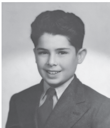
Der Autor im Alter von zehn Jahren.

tionierte: einfach einen Bezug zwischen dem begehrten Objekt und meiner Bildung herzustellen. Meine Eltern gaben kein Geld für irgendetwas Extravagantes aus, aber wenn es um etwas ging, das auch nur entfernt mit Lernen und Bildung zu tun hatte – Stifte, Papier, Lineale (erinnern Sie sich daran?) und Bücher, vor allem Bücher –, dann gaben sie mit beiden Händen. Als ich ihnen also sagte, ich würde das Fahrrad brauchen, um häufiger die wunderbare Washington Central Bibliothek an der Ecke Seventh und K Street besuchen zu können, konnten sie meinen Wunsch nicht ablehnen.