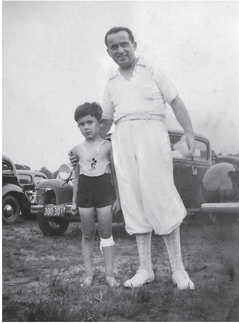
Der Vater des Autors, um 1927.

Dies war etwas Seltenes: auch wenn er zu dem Zeitpunkt das Geschäft schon verkauft hatte, war es immer noch schwer, ihn von meiner Mutter zu trennen. Er begann das Gespräch nie von sich aus. Er ging nie auf mich zu. Vielleicht fühlte er sich mir gegenüber unsicher, obgleich er bei seinen Männerfreunden keineswegs schüchtern oder gehemmt war – ich mochte es, wenn ich ihn mit ihnen lachen und Geschichten erzählen sah, wenn sie Binokel spielten. Vielleicht haben wir beide versagt: Er hat sich nie nach meinem Leben oder nach meiner Arbeit erkundigt, und ich habe ihm nie gesagt, dass ich ihn liebte. Unser Mittagsgespräch ist mir noch deutlich in Erinnerung. Wir unterhielten uns eine Stunde lang als Erwachsene, und es war ganz wunderbar. Ich erinnere mich noch, dass ich ihn fragte,