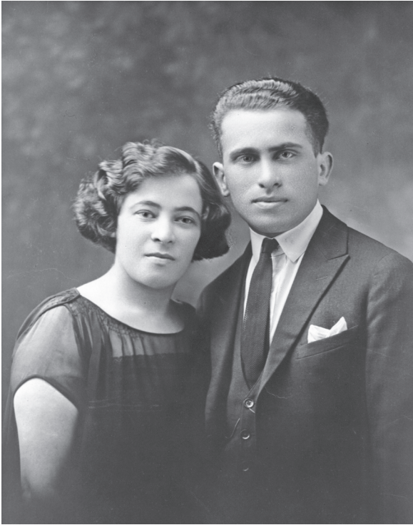
Vater und Mutter des Autors, um 1930.