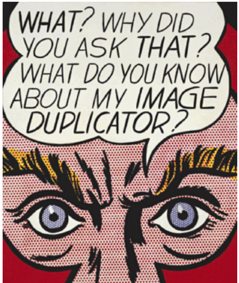
Abb. 1 Roy Lichtenstein, Image Duplicator , 1963, Acryl und Bleistift auf Leinwand, 61 × 50,8 cm, Privatsammlung

Auch Lichtenstein, der gegen Ende der 1950er-Jahre noch abstrakt malt, wendet sich nun diesen zeitgenössischen Themen und der Gegenständlichkeit zu. 1958 malt er erstmals anthropomorphe Comicfiguren wie Walt Disneys Micky Maus und Donald Duck oder Bugs Bunny (Warner Brothers) in einem gestisch-expressionistischen Stil (Abb. 2). Es heißt, Jasper Johns habe ihm daraufhin geraten, neben den Motiven auch die Ästhetik der industriellen Drucktechnik in seine Bilder zu übernehmen. Damit kommen sie dem realen Gegenstand näher, sind nicht Darstellung von etwas, sondern Trompe-l'Œilhaft das Objekt selbst, wie Jasper Johns Flaggenbilder von 1954/55.