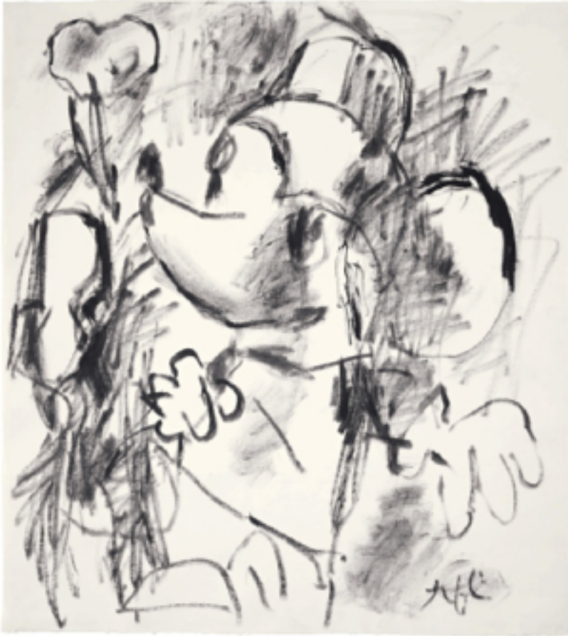
Abb. 2 Roy Lichtenstein, Mickey Mouse II , 1958, Tusche auf Papier, 53,8 × 48,4 cm, Privatsammlung

Zu Beginn des Jahres 1961 sind Warhols und Lichtensteins Kunst einander so ähnlich, dass der New Yorker Galerist Leo Castelli, nachdem er Look Mickey , das erste Bild in Lichtensteins nunmehr unpersönlichem, grafischem Stil der Comiczeichner, gesehen hat, zwar Lichtenstein zum großen Durchbruch verhilft, es jedoch bis 1964 ablehnt, gleichzeitig Warhol zu vertreten. Nur kurz, im Frühjahr 1961, malt Lichtenstein berühmte amerikanische Comichelden wie Micky Mouse oder Popeye. Auch Andy Warhol schafft im Frühjahr 1961 Bilder, in denen er berühmte Comicfiguren sowie Werbegrafik aufgreift. Vier dieser Bilder werden im April 1961 in einem Schaufenster des