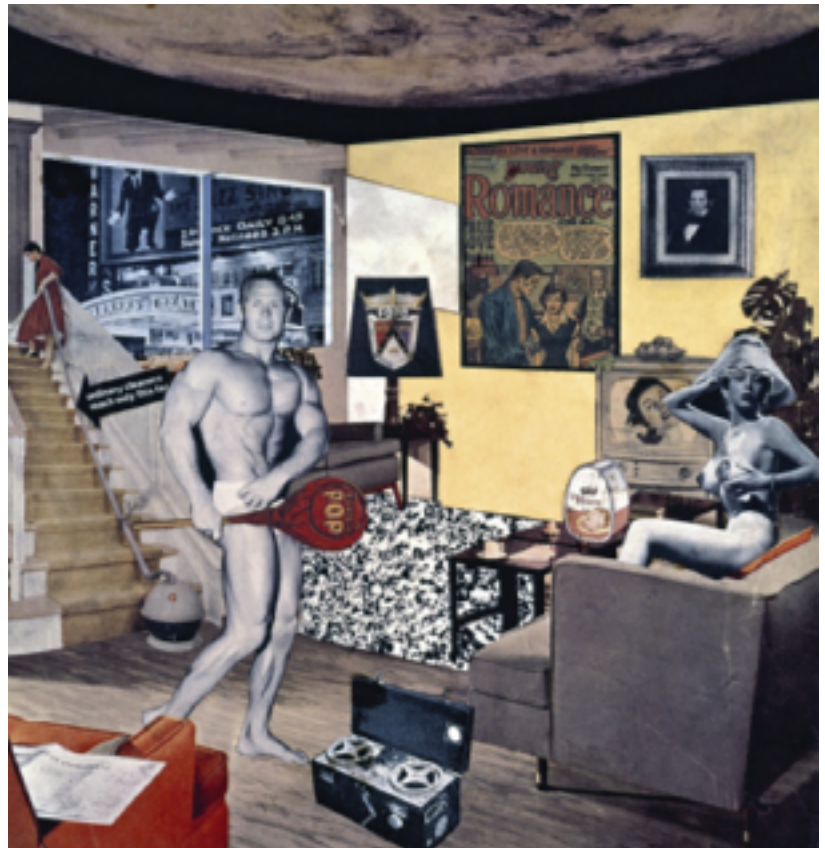
Abb. 3 Richard Hamilton, Just what is it that makes today's homes so different, so appealing? , 1956, Collage auf Papier, 26 × 24,8 cm, Kunsthalle Tübingen

Die in Zeitungen publizierten Comicstrips der ersten Comicmode in New York ab circa 1907/08 handelten vom lustigen Stadtleben und vom freien Menschen. Berührungen mit der Kunst gab es bei Lyonel Feininger, Paul Klee, Fernand Léger und Joan Miró. Picassos antifaschistische Bildgeschichte