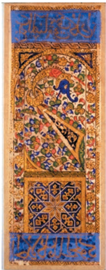
Ass der Stäbe

Geschichten über den Ursprung des Tarot gibt es viele. Es heißt, die Karten seien uralt und kämen aus Indien, Marokko oder aus Ägypten und hätten schon vor Jahrtausenden das Innere der Pyramiden geschmückt. Die nachprüfbar Geschichte ist dagegen eher kurz. Am Ende des 14. Jahrhunderts tauchten in Europa erstmals Karten auf, die vermutlich aus der islamischen Welt kamen. Karten aus dieser Zeit fand man im letzten Jahrhundert im Topkapi Museum in Istanbul. Sie stammen von den Mamelucken, einer Herrscherklasse, die seit dem 13. Jahrhundert Syrien und Ägypten regierten. Darauf sind erstmals die Symbole der vier Sätze zu sehen, die bis heute für Tarot-, aber auch für Spielkarten typisch sind: Schwerter (Pik), Kelche (Herz), Münzen (Karo) sowie die Stäbe, die zu Kreuz wurden. Als begeisterte Polospieler hatten die Mamelucken den Poloschläger zum Stabsymbol erhoben. In Europa aber fanden diese vier Serien interessanterweise eine Entsprechung in den vier mittelalterlichen Ständen: Schwerter = Ritter, Münzen = Kaufleute, Kelche = Klerus und Stäbe = Bauern.