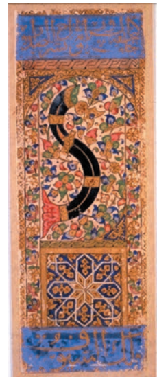
Ass der Schwerter