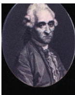
Antoine Court de Gébelin

Erst um 1505 taucht der Name Tarot in der italienischen Form als Tarocchi (Einzahl Tarocco) in Ferrara auf. Als Tarock wurde er im Deutschen ein Begriff für Kartenspiele, in der französischen Version gilt Tarot aber als der Name für das Kartenorakel. Was dieses Wort ursprünglich aussagte, ist leider nicht überliefert, dafür ranken sich umso mehr spekulative Interpretationen um seine mögliche Bedeutung. Sie reichen von königlicher Weg (Tar = Weg und Ro = König) über Thora, dem hebräischen Wort für Gesetz und der Sammelbezeichnung für die fünf Bücher Moses, bis hin zum Taro, einem norditalienischen Fluss, der durch Parma fließt.