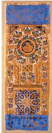
Ass der Münzen