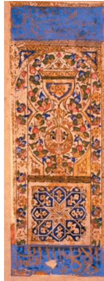
Ass der Kelche