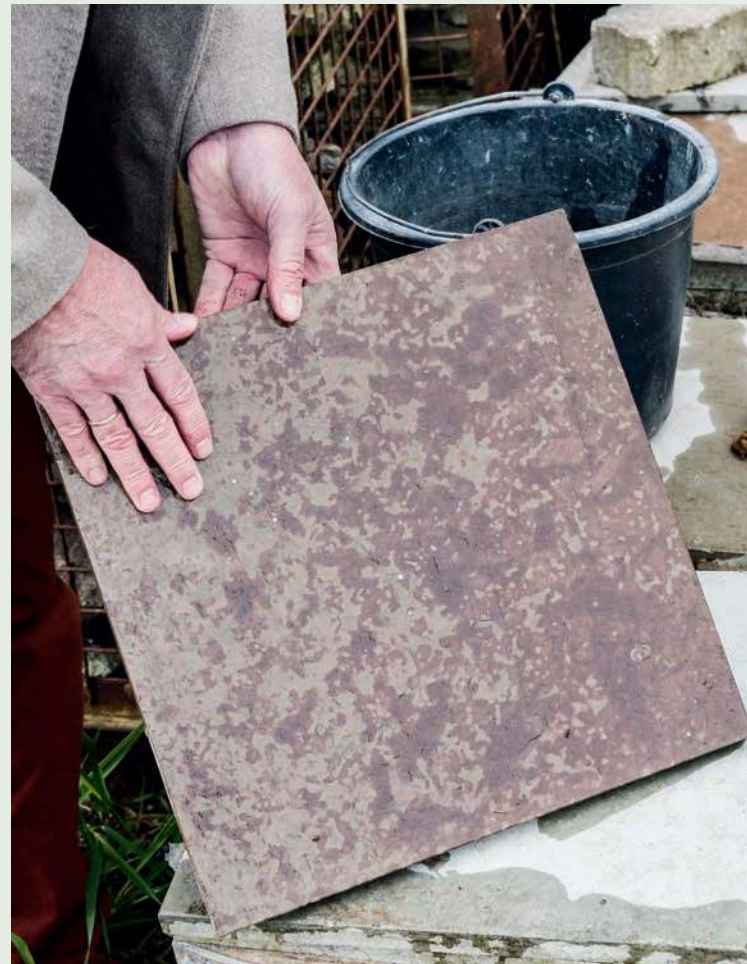
Was für ein Spektrum: Mal geht es um mannsgroße Findlinge, die individuell ausgesucht werden, mal um elegante Ölandplatten, wie sie in einem Pavillon verbaut werden.

erhöhen. Für den Parkplatz setzt man häufig wassergebundenen Grand, gebrochenes Natursteinmaterial, ein, der (wie ein Parkweg) sehr fest und gut befahrbar wird. Dagegen wird die Einfahrt in eine Tiefgarage (auf Kellerniveau) meist mit Granitkleinpflaster im Format 9/11 ausgestattet (in seltenen Fällen auch mit einer Elektroheizung im Unterbau). Sie sollte unbedingt ein sorgfältig durchdachtes Gefälle mit weichen Übergängen haben.