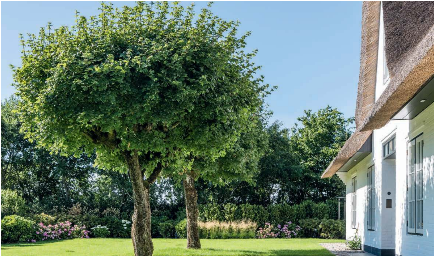
Der Garten hat vielerlei Facetten. Zu den beeindruckendsten Orten rund um das Haus gehört der windgeschützte Platz mit dem riesigen Tisch und seiner Natursteinplatte: die Schönheit des Einfachen.