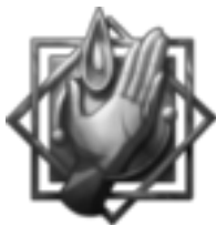
Paragon der Berührung »Die Hand kennt keine Furcht!« Die Tapferen