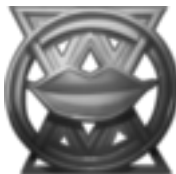
Paragon des Geschmacks »Die Zunge spricht die Wahrheit!« Die Aufrichtigen