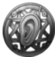
Paragon des Klangs »Die Ohren hören alles!« Die Geduldigen