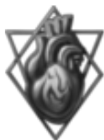
Paragon des Temperaments »Das Herz schlägt wahrhaftig!« Die Intuitiven