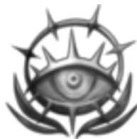
Paragon der Sicht »Die Augen sehen klar!« Die Weisen