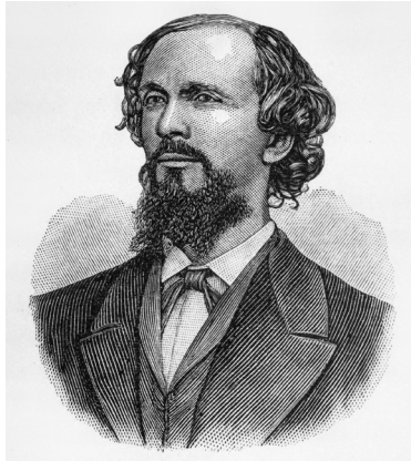
Karl Heinrich Ulrichs, Vorkämpfer für die Homosexuellenrechte

Aber als Ulrichs an diesem Morgen den imposanten Odeonsplatz überquerte, gesäumt von Regierungs- und Kulturgebäuden, und vorbei an der klassizistischen Loggia der Feldherrnhalle und den barocken Türmen und dem Dom der Theatinerkirche auf das Odeon zugging, schlug sein Herz so heftig, dass er fast meinte, es hören zu können. Eine innere Stimme raunte ihm, wie er später erzählte, zu: »Noch ist's Zeit, Numa! zu schweigen. Auf das bereits erbetene Wort brauchst du nur ganz kurz zu verzichten. Dann hat all' dein Herzklopfen ein Ende!« Aber Ulrichs dachte auch an die »Naturgenossen«, die auf seinen Protest zählten – »Ihr Vertrauen auf mich, sollte ich's den erwidern mit Feigheit?« –, und erinnerte sich an einen verzweifelten Kameraden, der Selbstmord begangen hatte, um der Strafverfolgung wegen Sodomie und der daraus folgenden öffentlichen Demütigung zu entgehen. »Mit hoch klopfendem Busen« betrat Ulrichs das Gebäude, stieg auf das Rednerpodest und machte sich daran, seinen Text vor den über 500 versammelten Juristen vorzutragen. »Meine Herren!«, hob er an, »gerichtet ist dieser Antrag auf eine Revision des bestehenden materiellen Strafrechts«, um die Verfolgung einer unschuldigen Personengruppe zu beenden. »Endlich handelt es sich«, fuhr er fort,